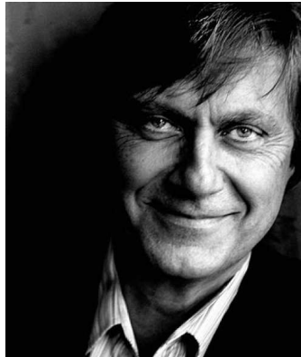
Lasse Hallström (geboren am 2. Juni 1946 in Stockholm)

Deutscher Titel: Gilbert Grape. Irgendwo in Iowa